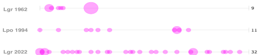
Figur 3 - Fördelningen av förekomsten av Häls*

Ökningen sett till den relativa frekvensen verkar till synes mest dramatisk mellan 1962 och 1994, dock skall klargöras att detta kan vara på grund av den stora skillnaden i omfattning på kursplanerna då det skiljer nära 5000 ord mellan dessa. Samtidigt kan en tydlig ökning före och efter millennieskiftet observeras med två uppåtgående kurvor för den relativa frekvensen gällande såväl häls* som hälsa till 2022. Detta utan en större distinktion i omfattning då 2022 års kursplan faller mellan de två tidigare nämnda. Vidare kan konstateras att det även skett en förändring gällande vart häls* nämns i dokumenten, se figur 3. Häls* kan observeras koncentrerat till de inledande sidorna i -62 års kursplan medan det i Lpo 94 förekommer i olika skeenden av texten, både i inledningen och mot den senare halvan, dock är orden fortsatt koncentrerat till sjok av frekvent användning för att sedan vara frånvarande i resterande delar. Den största skillnaden går att se om man blickar till -22 års kursplan, där finns häls* med genomgående över hela dokumentet, trots att det även här förekommer sjok av mer frekvent användning, finns inte samma tomrum.