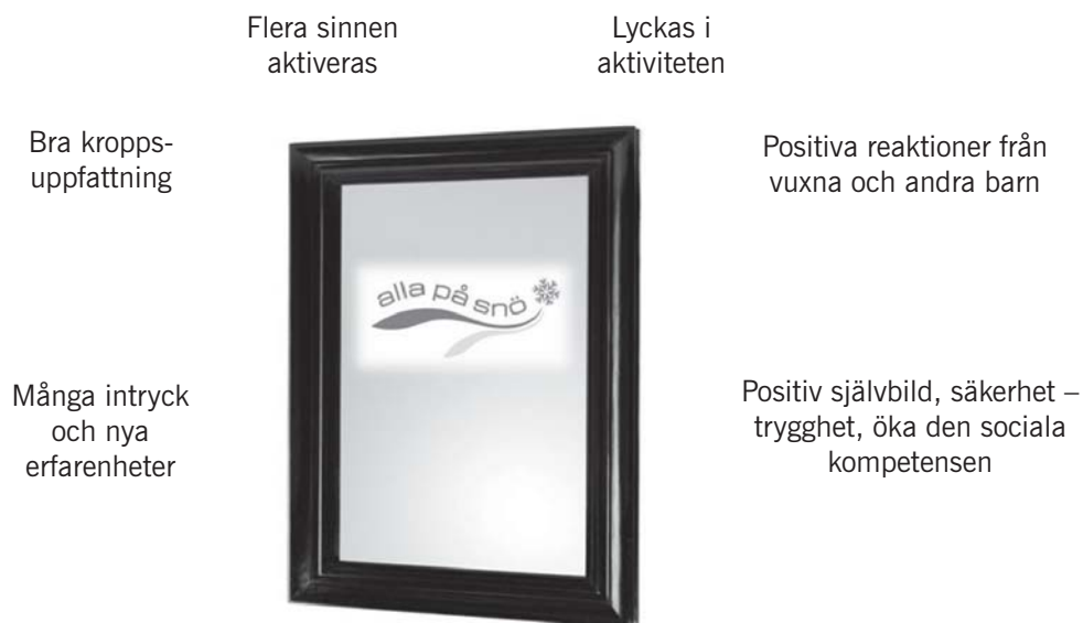
Figur 2. Grafisk illustration av den didaktiska arbetsmodellen: Vinterfriluftslivets goda spegel.