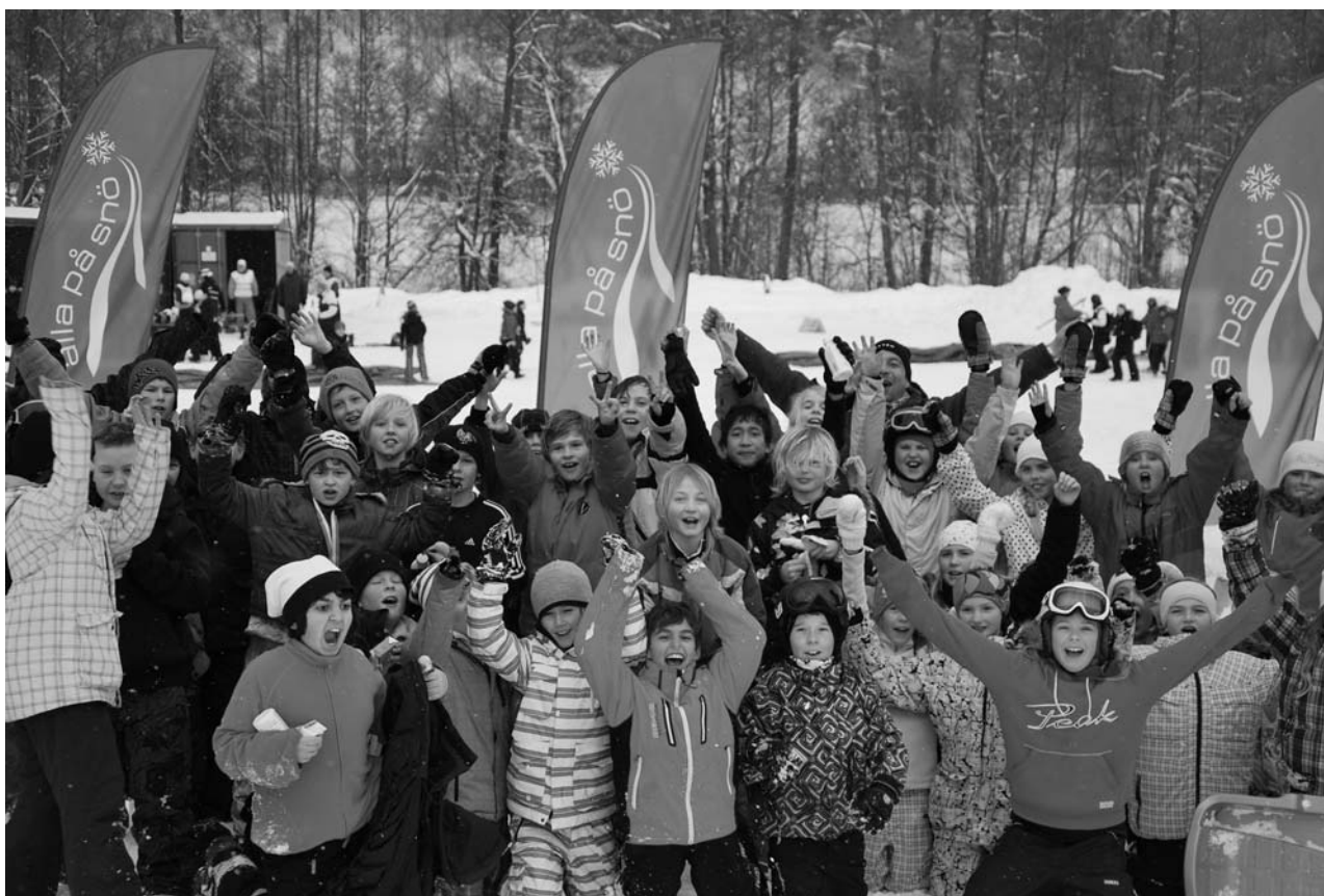
Deltagare "Alla på snö" i Norrköping 2010.