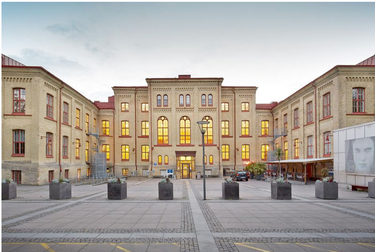
Institutionen för kost- och idrottsvetenskap. Göteborgs universitet

En av bokens främsta förtjänster, som jag ser det och som jag delvis har berört tidigare, är att den är rik på information om sakförhållanden, av typen vem som har gjort vad, vad som har hänt, vem som har haft kontakt och samarbetat, när händelser har inträffat, och så vidare. Det är värdefullt att information som detta nedtecknas och sammanställs så att den finns tillgänglig för fler personer över längre tid, och inte enbart i minnet hos dem som var med "då det begav sig". Inte minst gäller detta den väv av relationer mellan inblandade aktörer som författarna väver genom sina beskrivningar, något som kan vara svårt att "få tag i" via andra typer av källor.