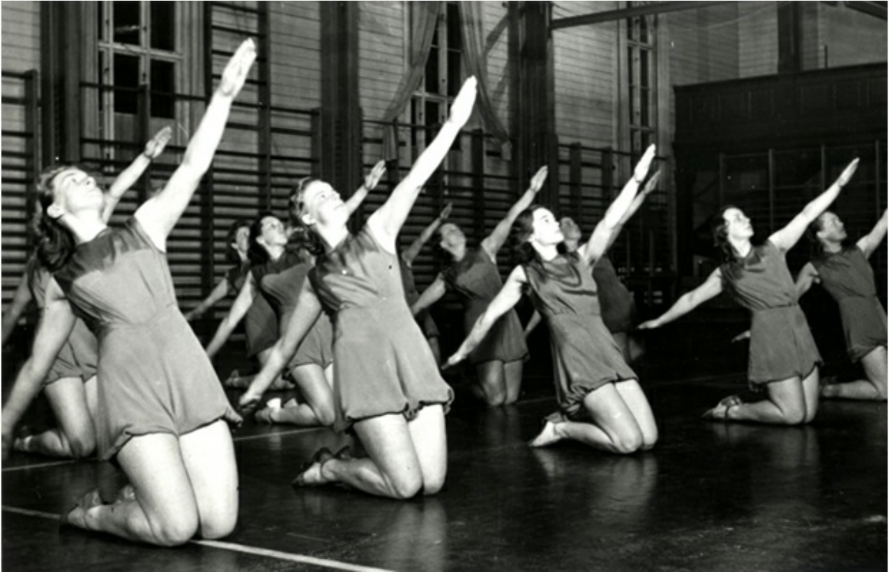
Karlstads GF/ Solstadsflickorna vid uppvisning, tidigt 1940-tal (bild ur boken).

framför brasan. Nej, långtifrån. Den vänder sig till den professionella idrottshistorikern eller till personer med genuint intresse för Värmlands (idrotts-) historia. Den kräver oerhört mycket av läsaren: full koncentration, närläsning i korta perioder, vässad penna och en rejäl kaffemugg rekommenderas. Det som underlättar läsningen och resultatförståelsen är att Janzon är generös med återkommande korta konklusioner samt rejäla kapitelsammanfattningar.